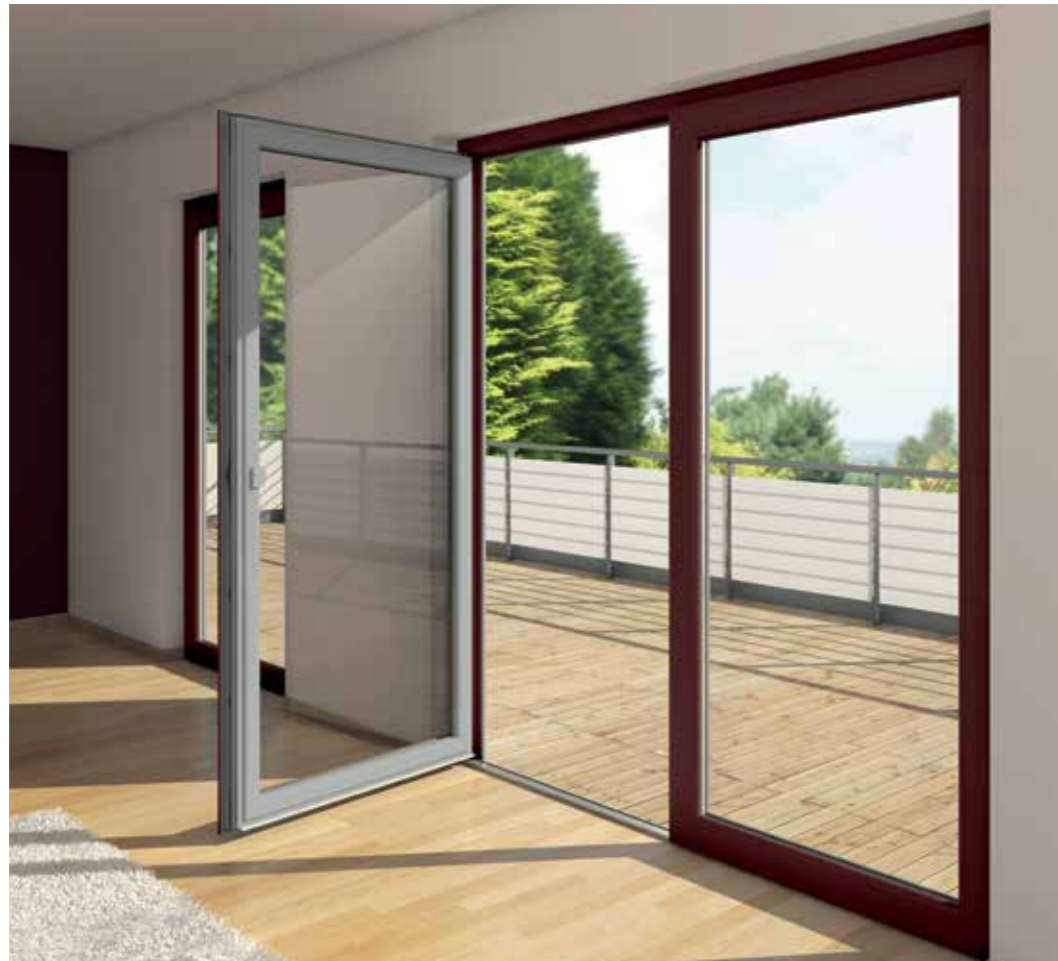
Możliwość realizacji kreatywnych projektów zarówno na zewnątrz, jak i wewnątrz budynków dzięki wykończeniu powierzchni w technologii Schüco AutomotiveFinish.