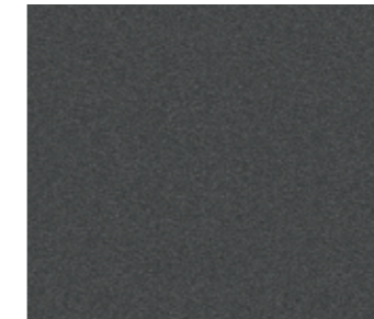
SAF-DB 703 matowy