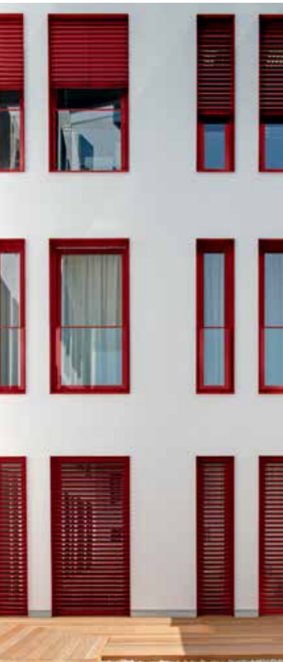
Schüco AutomotiveFinish to idealne połączenie nowych możliwości wyrazu z atrakcyjną ceną.