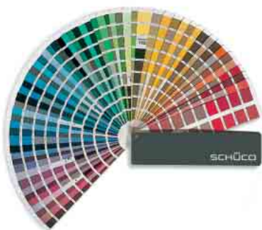
RAL- und Eloxal-Farben