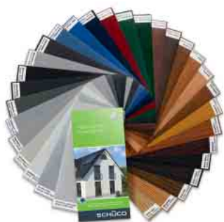
Schüco Farb- und Holzdekore